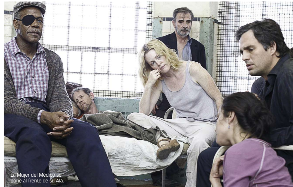
La Mujer del Médico se pone al frente de su Ala.

diendo su poder y deja de ser el hombre seguro. Por eso necesitará mostrar su masculinidad. Al final de la película mira a su mujer con otros ojos.