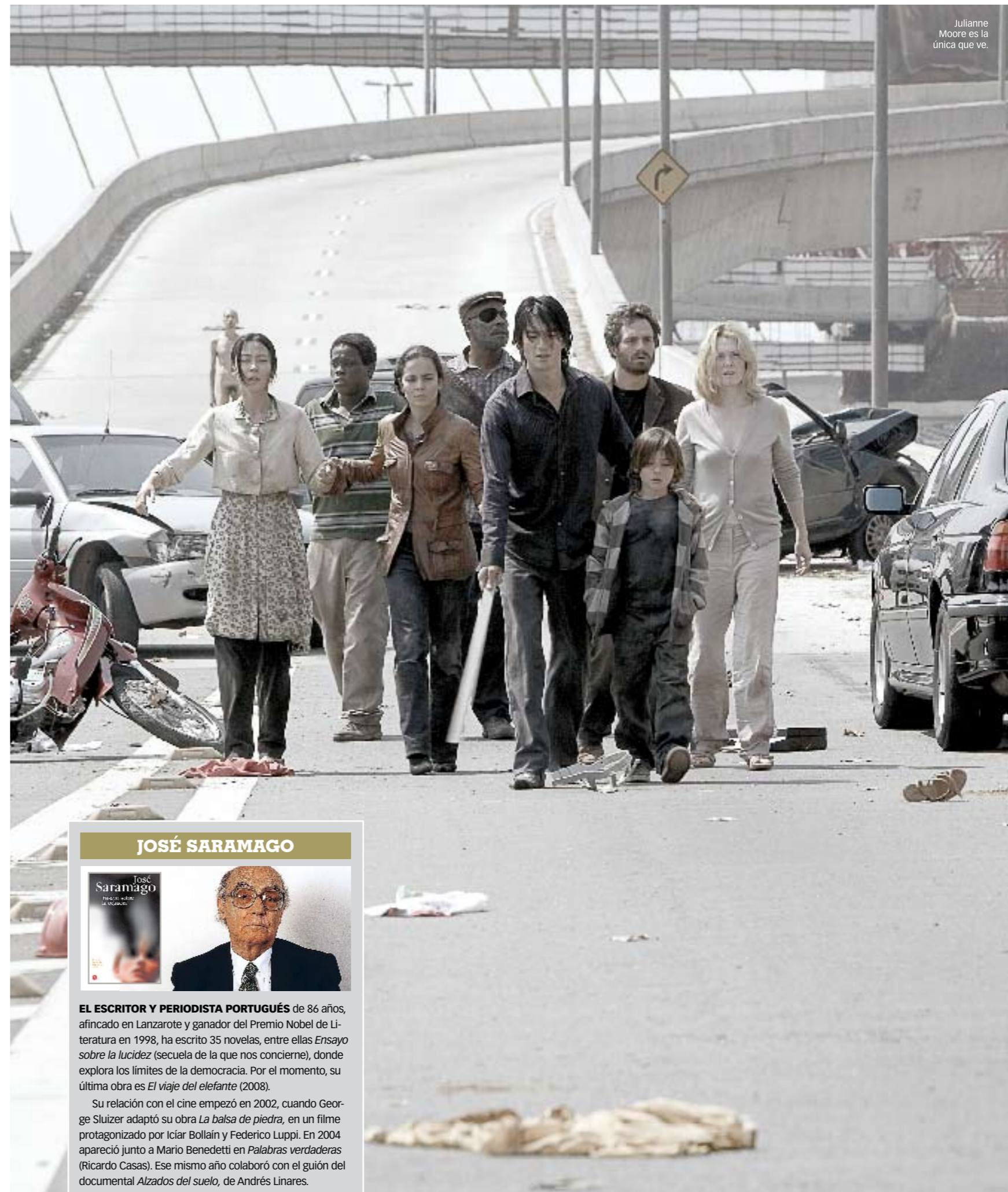
Julianne Moore es la única que ve.

Me gusta cómo evoluciona el personaje de Mark Ruffalo [el oftalmólogo y primer contagiado], al principio es un doctor un poco arrogante que no valora a su mujer. Una vez que están en cuarentena, poco a poco siente que está per-