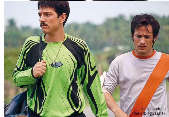
... 'eclipsando' a Beto (Diego Luna).