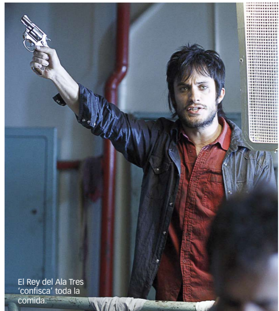
El Rey del Ala Tres 'confisca' toda la comida.